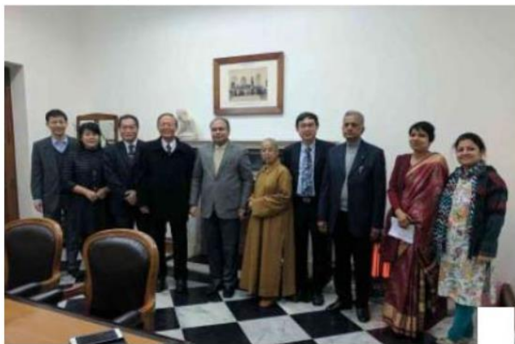
與德里大學校長合影